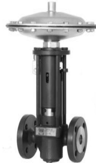
art.nr. MPA 46